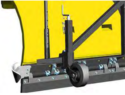
2. Lenkrollen SNK mit Einstellscheiben.